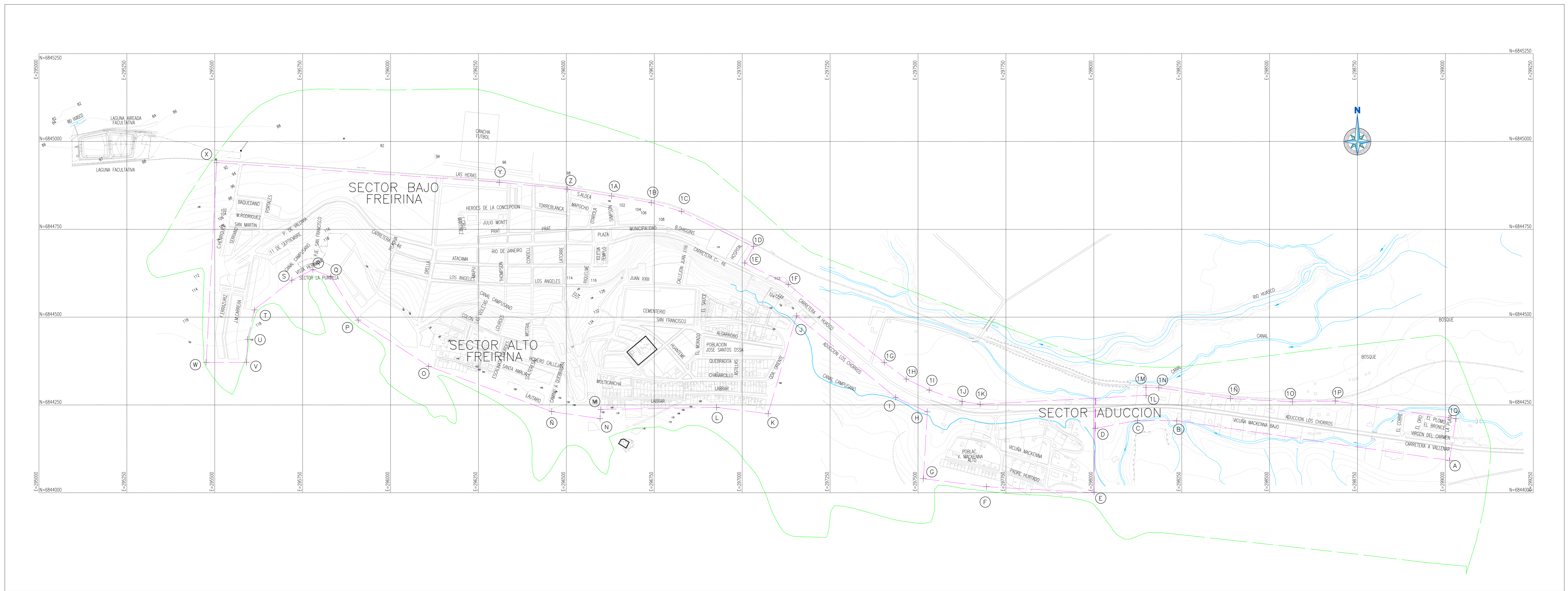
PLANTA GENERAL FREIRINA TERRITORIO OPERACIONAL ESCALA 1:5.000

AREA OPERACIONAL = 108,20 Hs. LIMITE URBANO = DECRETO N°2.832 APROBADO EL 15-10-2009 Y PUBLICADO EN EL DIARIO OFICIAL EL 14-12-2009